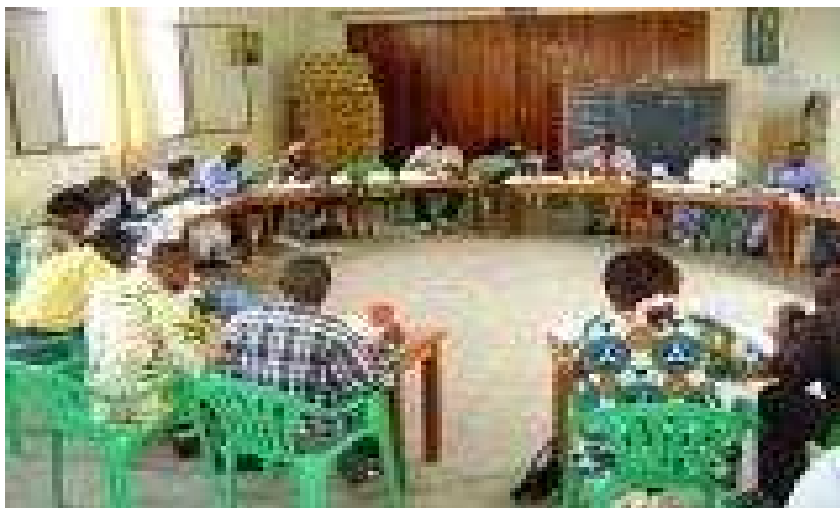
Chacun se présente et expose brièvement sa motivation à suivre cette formation.