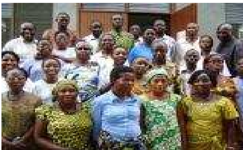
Une photo de famille clôture cette première formation à Kimuenza / Kinshasa