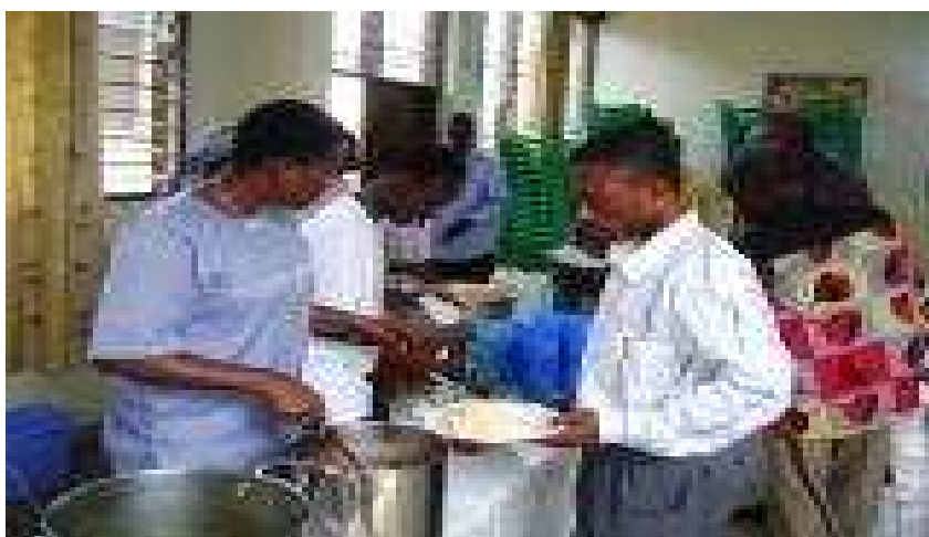
A midi, un temps de pause et de restauration.