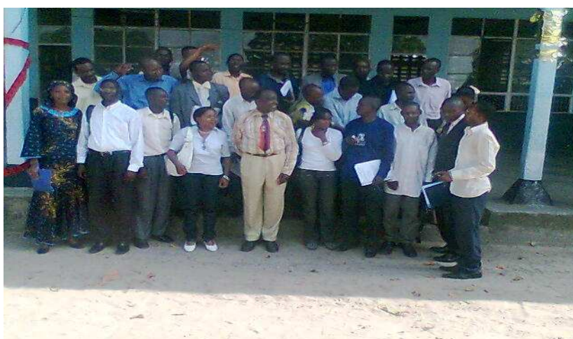
Photo de « famille » avec le noyau qui forme désormais le premier Cercle congolais