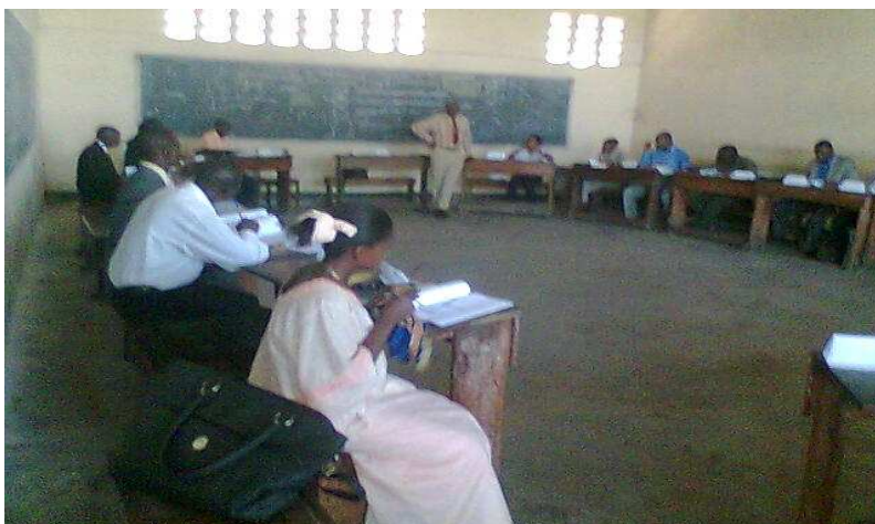
Les participants découvrent activement les quatre étapes de la CNV. Kinshasa/Congo (RDC)